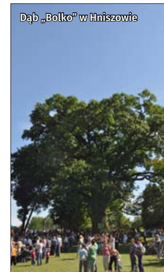
Dąb „Bolkko” w Hniszowie

nocować lub odpocząć. Dodatkową atrakcją w Majdanie Stuleńskim stanowi Stajnia Rajdowa Geronimo, dla tych którzy zechcą chociaż na chwilę zamienić rower na konia.