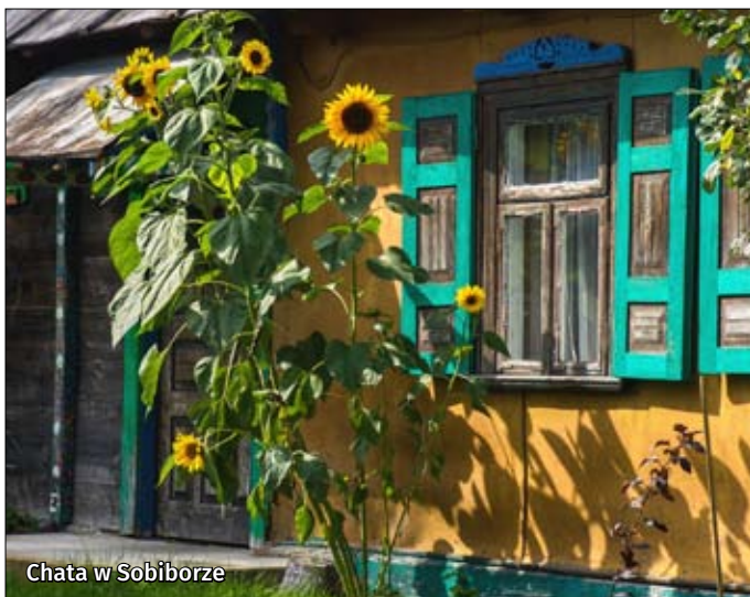
Chata w Sobiborze

Na obszarze Poleskiej Doliny Bugu występuje wiele ścieżek rowerowych ukazujących jej walory przyrodniczo-krajoznawcze i historyczne. Są to szlaki o zróżnicowanym poziomie trudności, o różnej nawierzchni, głównie prowadzące po terenach równinnych. Dostępność szlaków często jest zależna od pory roku i warunków pogodowych, szczególnie tych wiodących po drogach gruntowych. Najciekawsze z nich to Nadbużański Szlak Rowerowy, szlak „Stykiem Granic”, trasa rowerowa Lublin-Wola Uhruska, szlak Kulczyn Kolonia-Krowie Bagno-Hańsk oraz szlak Śladami Wschodnio-Słowiańskiej Tradycji Cerkiewnej na Polesiu Lubelskim. Więcej informacji na temat przebiegu szlaków oraz atrakcji i ciekawostek występujących na trasach można uzyskać się na stronie internetowej www.informacja.wlodawa.pl .