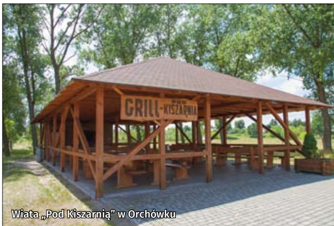
Wiąta „Pod Kiszarnią” w Orchówku

Na obszarze Poleskiej Doliny Bugu występuje wiele ścieżek rowerowych ukazujących jej walory przyrodniczo-krajoznawcze i historyczne. Są to szlaki o zróżnicowanym poziomie trudności, o różnej nawierzchni, głównie prowadzące po terenach równinnych. Dostępność szlaków często jest zależna od pory roku i warunków pogodowych, szczególnie tych wiodących po drogach gruntowych. Najciekawsze z nich to Nadbużański Szlak Rowerowy, szlak „Stykiem Granic”, trasa rowerowa Lublin-Wola Uhruska, szlak Kulczyn Kolonia-Krowie Bagno-Hańsk oraz szlak Śladami Wschodnio-Słowiańskiej Tradycji Cerkiewnej na Polesiu Lubelskim. Więcej informacji na temat przebiegu szlaków oraz atrakcji i ciekawostek występujących na trasach można uzyskać się na stronie internetowej www.informacja.wlodawa.pl .