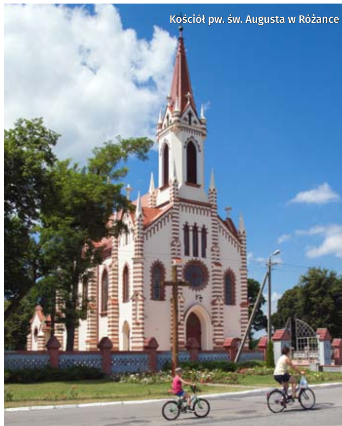
Kościół pw. św. Augusta w Różance

Kontakt do przewodników wycieczek jest dostępny na stronie internetowej www.okuninka-biale.pl w zakładce Przewodnicy lub w Punktach Informacji Turystycznej we Włodawie (tel. 82 5722069, 668 180 746) i w sezonowym Punkcie Informacji Turystycznej w Okunince nad Jeziorem Białym (tel. 880 564 552).