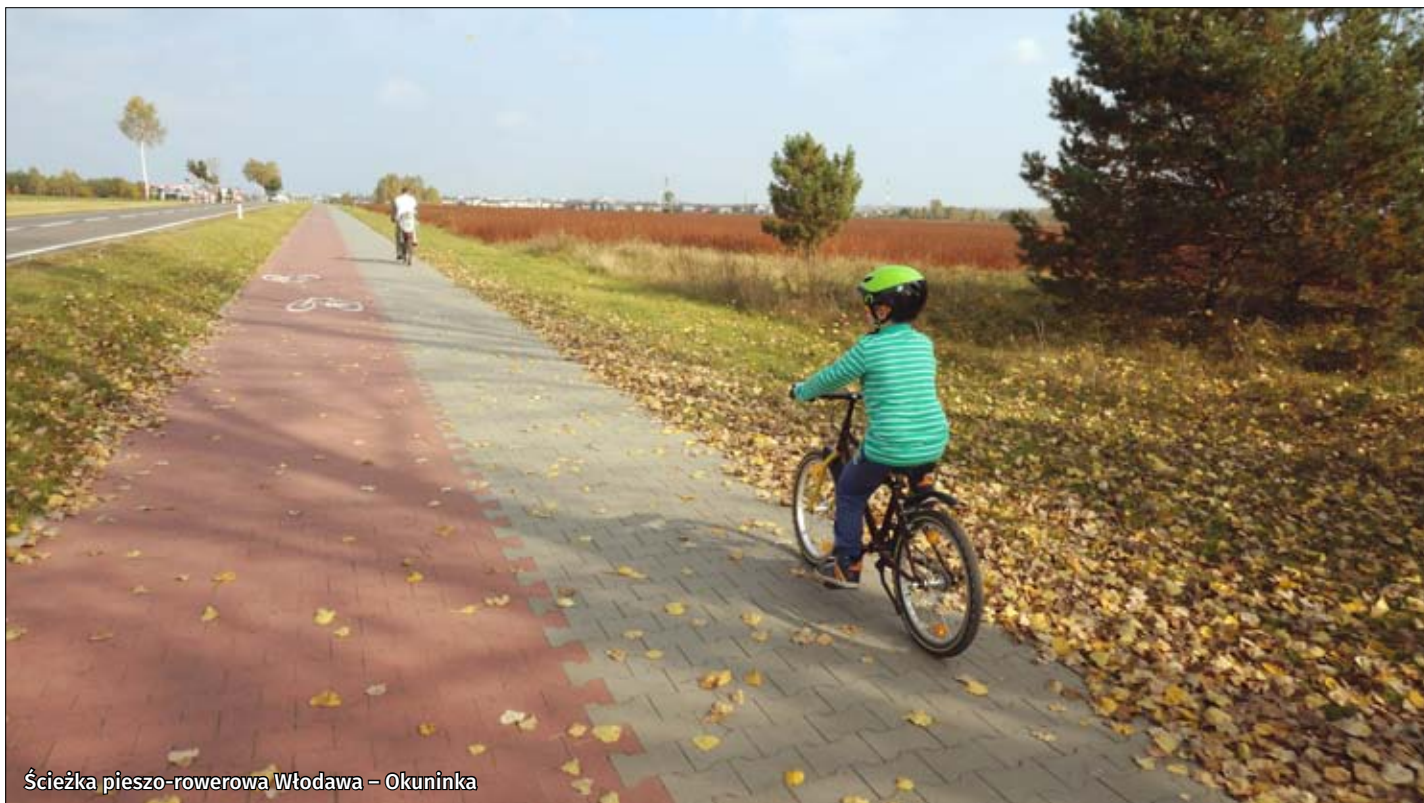
Ścieżka pieszo-rowerowa Włodawa – Okuninka

informacja.wlodawa.pl. Najnowszym szlakiem jest Trasa Rowerowa Polski Wschodniej (województwo lubelskie, dł. około 350 km), która wiedzie przez 5 wschodnich województw. Na obszarze Poleskiej Doliny Bugu trasa, od Hanny do Rudy Huty, ma długość około 80 km i przebiega głównie wydzieloną ścieżką wzdłuż drogi wojewódzkiej nr 816, tzw. Nadbużanka. Za Jeziorem Białym trasa odbija w stronę Sobiborskiego Parku Krajobrazowego i prowadzi przez śródlęsną drogę, następnie w okolicach Wołczyn dalej Nadbużanką aż za okolice Woli Uhruskiej. Trasa wiedzie przez miejsca cenne pod względem przyrodniczymi i kulturalno-historycznym, takie jak: drewniany kościół pw. św. św. Apostołów Piotra i Pawła w Hannie wzniesiony w XVIII w., Włodawa – miasto trzech kultur, Muzeum Byłego Obozu Zagłady w Sobiborze, kościół pw. św. Jana Chrzciciela w Uhrusku z XVII w. Za Uhruskiem odbijając nieco ze szlaku na terenie podworskiego parku w Hniszowie można odpocząć w cieniu 600-letniego dębu „Bolkko”, największego na Lubelszczyźnie. Na trasie szlaku, w Majdanie Stuleńskim znajduje się hotel z restauracją, strzelnicą golfową i spa dla osób, które tam zechcą prze-